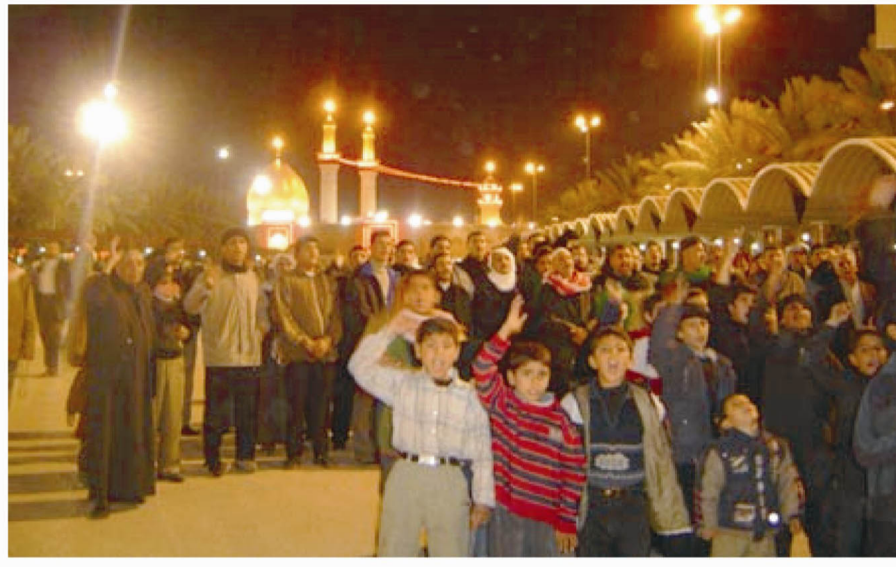
بغداد/ النجف الأشرف/ البيان

مجالس العزاء بهذه المناسبة. وكانت قيادة عمليات بغداد خطة فرض القساون قد أعلنت تطبيقها خطة أمنية خاصة لهذا الشهر. من جانبها توشت مدينة النجف الأشرف بالسواد العاشوراني استعداداً لإحياء ذكرى واقعة الطف ذكرى انتصار السيف على الدم. وشبهت تجمعات عدة تعود عليها النجفيون وأصحاب الموكب في مثل هذه الأيام، لاسيما في الأوقات التي تعرف باسم الطرف كطرف البراق وطرف المشراق،